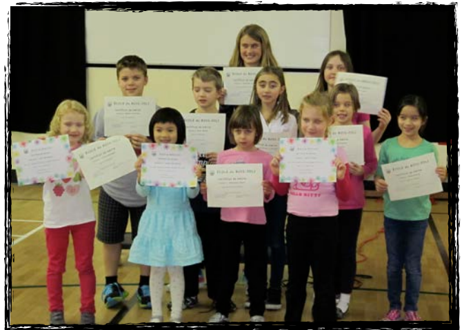
Assemblée du mois de janvier

Le conseil étudiant de l'école du Bois-joli aimerait remercier tout ceux qui ont apporté des denrées alimentaires non-périssables ainsi que des jouets pour les enfants !