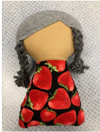
Poupée Kookum (grand-mère) choisie par le club autochtone et offerte à la classe des maternelle et 1ère année

Sortie autochtone au Hoobiye (nouvel an) de la nation Nisga'a. Danse, tambours et chants de l'école Maaqtusiis à Ahousat (C.-B.). Dégustation de bannique avec baies (bleuets, mûres et framboises) et crème